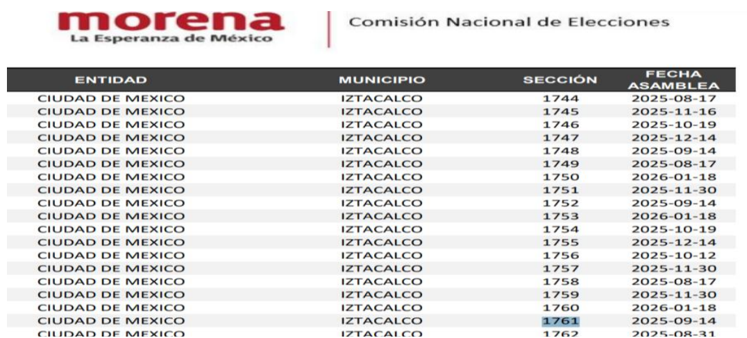
Ilustración 1. Tomada fielmente del acuerdo referido anteriormente, donde se puede apreciar la existencia de la sección 1761.

A fin de robustecer lo anterior se adjunta evidencia gráfica del apartado correspondiente al listado de secciones de la alcaldía Iztacalco contenido en la página 337 del acuerdo antes mencionado.